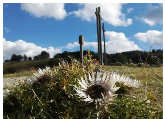
Silberdistel am Kreuzberg

Stempel(s)pass: Begeben Sie sich zu unseren höchsten Gipfeln und sammeln Sie bei tollen Ausblicken die Stempel für Ihren Gipfel-Pass. Genauere Informationen erhalten Sie auf www.bischofsheim.info/wandern/gipfel-pass