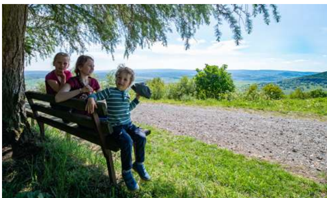
Familienzeit in der Rhön