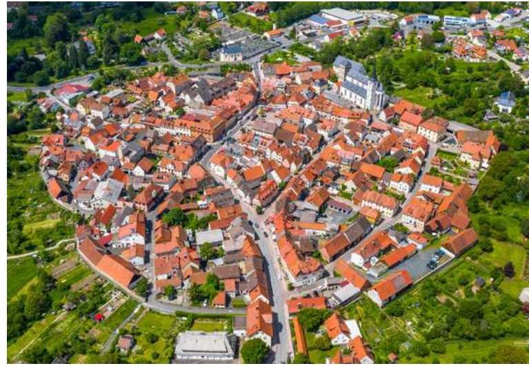
Fränkischer Rundling von oben

Die Altstadt von Bischofsheim, eingefasst von der noch fast vollständig erhaltenen Stadtmauer, lädt mit ihrem historischen Flair zum Verweilen ein. Neue altstadtnahe Erholungsbereiche entlang des Baches Brend, z. B. ein Wasserspielplatz sowie ein Klangweg, erhöhen die Freizeitqualität zusätzlich. Der kleine Ort ist voll von Kunst, Kultur und Geschichte(n).