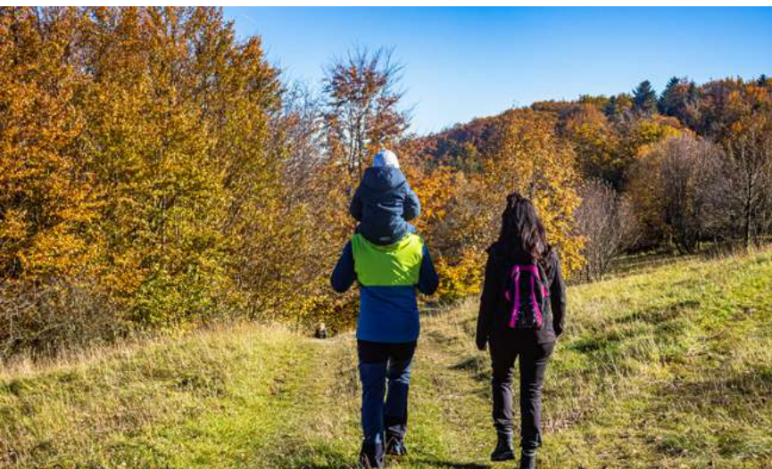
Wandern mit Familie

Also dann, auf ins Schneevergnügen! 25 km Winterwanderwege, 70 km Langlauf-Loipen, 7 Skilifte am Arnsberg und Kreuzberg, Rodelhänge z. B. auf der Klosterwiese am Kreuzberg oder beim Gasthof Roth warten auf Sie.