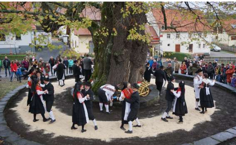
Kirchweih-Plantanz um die Linde