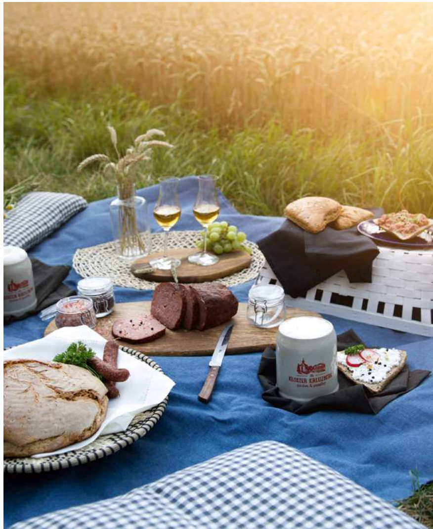
Picknick im Grünen

Bei unseren kulinarischen Aktionswochen, z. B. den Bärlauchwochen im Frühjahr oder den Wildwochen im Herbst genießen Sie Rhöner Spezialitäten vom Feinsten. Die beiden Wirtvereinigungen „Rhöner Charme“ und „Aus der Rhön – für die Rhön“ haben sich besonders der regionalen Küche gewidmet. Im Rahmen der Premiumstrategie für Lebensmittel des Bayerischen Staatsministeriums für Ernährung, Landwirtschaft und Forsten wurde Bischofsheim 2018 sowie erneut 2024 nach einer erfolgreichen Bewerbung als Bayerischer Genusssort ausgezeichnet. Seit 2012 ist Bischofsheim auch Mitglied bei cittaslow, der weltweiten Vereinigung der lebenswerten Städte, die auch und insbesondere großen Wert auf regionale Produkte und Gastronomie legt.