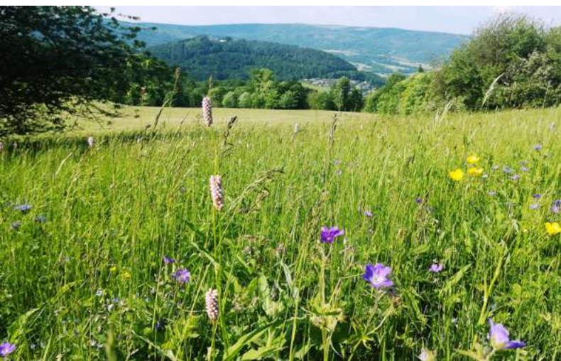
Bergwiese am Kreuzberg

Die zahlreichen Holzbildhauerwerkstätten, die älteste Holzschnitzschule Deutschlands und die Holzsulpturen, die das Stadtbild zieren, stellen weitere Besonderheiten dar und stehen für eine lange Tradition als Holzschnitzerstadt.