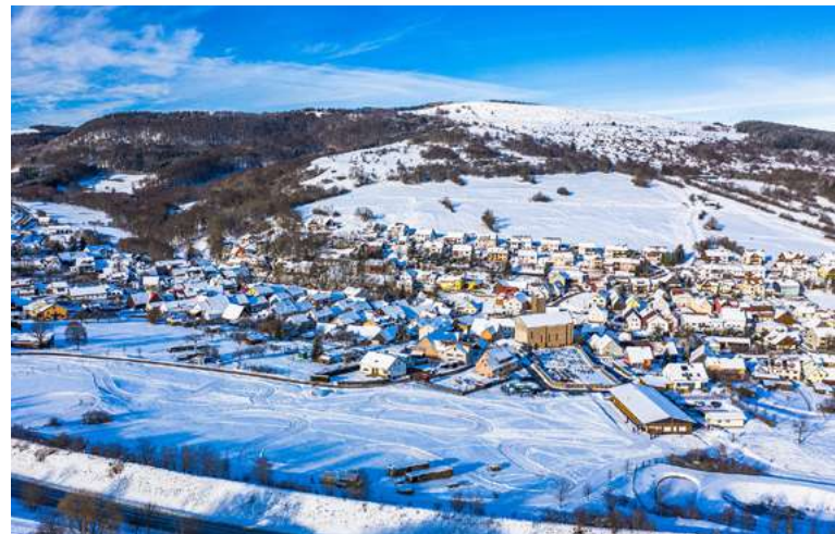
Oberweißenbrunn im Winter

Um Oberweißenbrunn herum und am Arnsberg findet man sowohl Skilifte als auch Langlaufloipen. Sehenswert ist auch die Oberweißenbrunner Kirche, vor allem im Innenbereich.