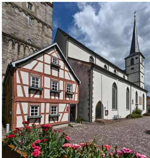
Messnerhäuschen und Stadtpfarrkirche

Die zahlreichen Holzbildhauerwerkstätten, die älteste Holzschnitzschule Deutschlands und die Holzsulpturen, die das Stadtbild zieren, stellen weitere Besonderheiten dar und stehen für eine lange Tradition als Holzschnitzerstadt.