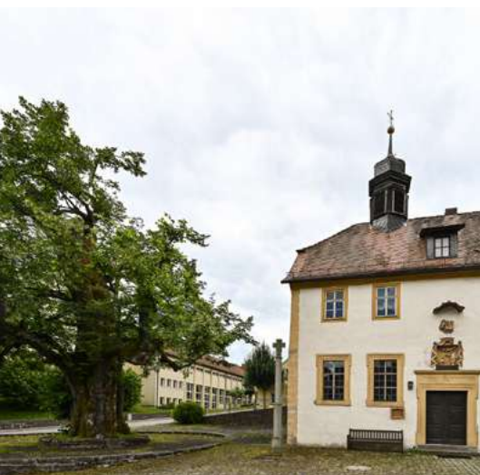
Dorflinde und Kapelle in Haselbach

Sehenswürdigkeiten: Kiliansbrunnen, 800-jährige Dorflinde, Franziskanerkloster Kreuzberg mit Wallfahrtskirche und Brauerei, Bruder Franz Haus, Johannisfeuer (Blockmeer), vorgeschichtliche Ringwallanlage, Sender Kreuzberg