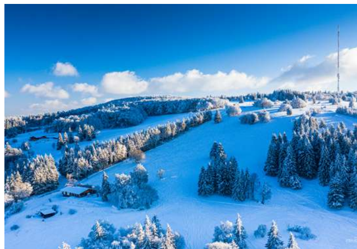
Kreuzberg im Winter