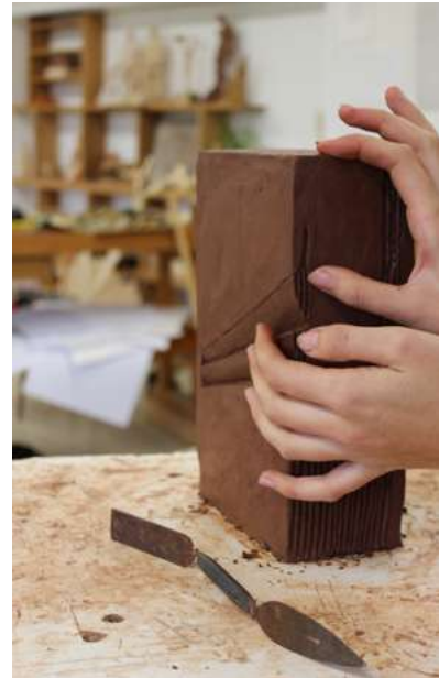
Modellieren in Ton