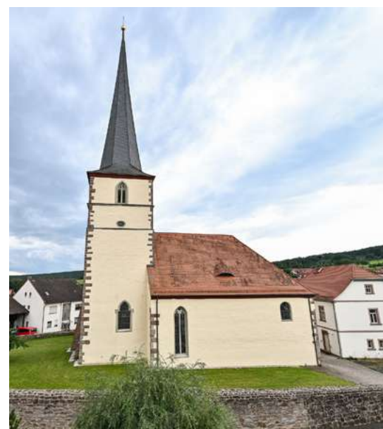
Kirche St. Peter und Paul in Wegfurt

Sehenswürdigkeiten: Kirche St. Peter und Paul