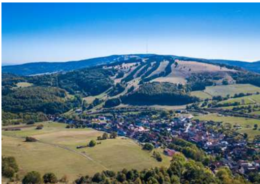
Oberweißenbrunn von oben

Eingebettet zwischen Arnsberg und Himmeldunkberg liegt Oberweißenbrunn, etwa 6 Kilometer nordwestlich von Bischofsheim. Hier starten zahlreiche Wanderwege und Mountainbike-Routen. Mit 620 Metern über NN ist Oberweißenbrunn das höchstgelegenste Dorf in Unterfranken. Dementsprechend hat es sich, ähnlich wie Haselbach, zu einem Wintersportzentrum entwickelt.