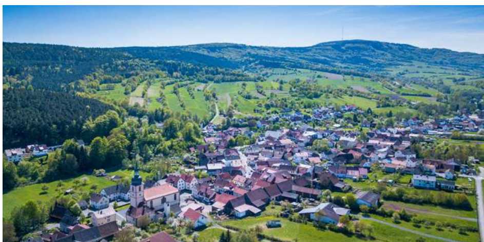
Unterweißenbrunn von oben

Sehenswürdigkeiten: Kirche mit barocker Ausstattung, Fachwerkhäuser, Naturschutzgebiet der Stufenheckenlandschaft beiderseits der Brend, Geißbrüche