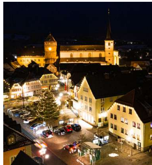
Bischofsheim bei Nacht

Sehenswürdigkeiten: Ruine Osterburg, Schwedenwall, Franzosenmauer