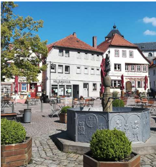
Marktplatz mit Brunnen