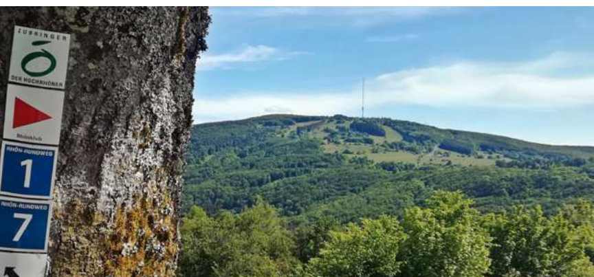
Blick auf den Kreuzberg

Tipp: Lassen Sie sich während unserer Wander- und Naturerlebniswochen im Frühjahr und Herbst von unseren ausgebildeten Wanderführern die schönsten Flecken der Rhön und den ein oder anderen Geheimtipp zeigen. Das aktuelle Programm und die Termine finden Sie auf www.bischofsheim.info oder fragen Sie in der Tourist-Information nach.