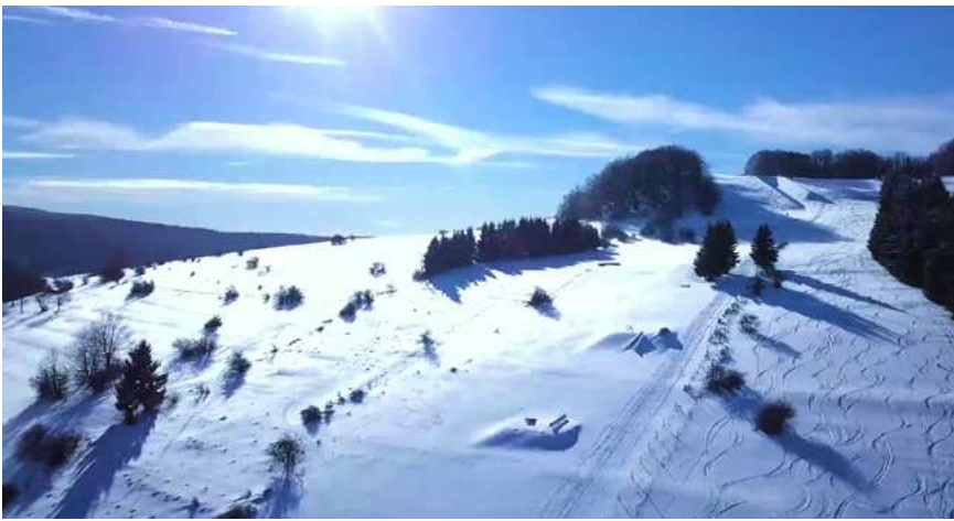
Winterlandschaft am Kreuzberg