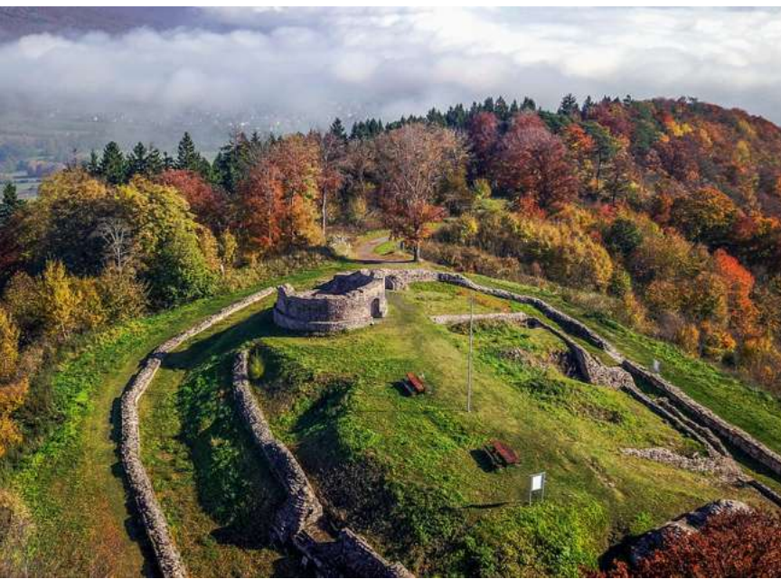
Osterburg im Herbst