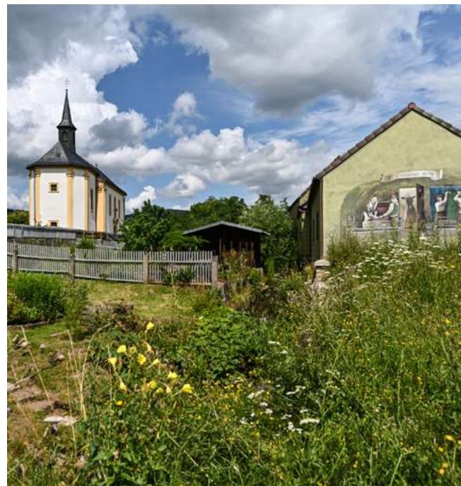
Josephskapelle und Färberzwinger