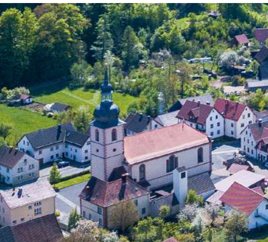
Kirche St. Katharina in Unterweißenbrunn

Brendabwärts, zwei Kilometer östlich von Bischofsheim, liegt der Stadtteil Unterweißenbrunn. Hier findet man alte und neue Bausubstanz in einem ansprechenden Miteinander. Die sehenswerte Kirche St. Katharina von 1817 mit mittelalterlichem Turmunterbau besitzt sowohl eine barocke als auch eine klassizistische Ausstattung. Gegenüber steht ein gut restauriertes altes fränkisches Fachwerkhäuser. Der Dorfplatz mit der Linde, dem Brunnen und dem Brauhaus ist der Mittelpunkt des Dorfes und Schauplatz von Dorffesten, die sich zur Wahrung der örtlichen Identität bestens bewährt haben. Eine optimale Gelegenheit für Sie, Land und Leute kennenzulernen!